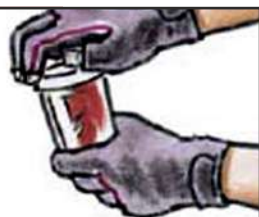
Ouvrir un bocal

Trendmail SA, Service-Center Bahnhofstr. 23, 8575 Bürglen TG Tel. 071 634 81 25 Fax 071 634 81 29 www.trendmail.ch