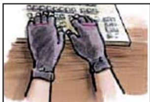
Taper au clavier